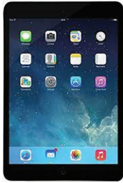
Tablet Apple iPad Wi-Fi Only